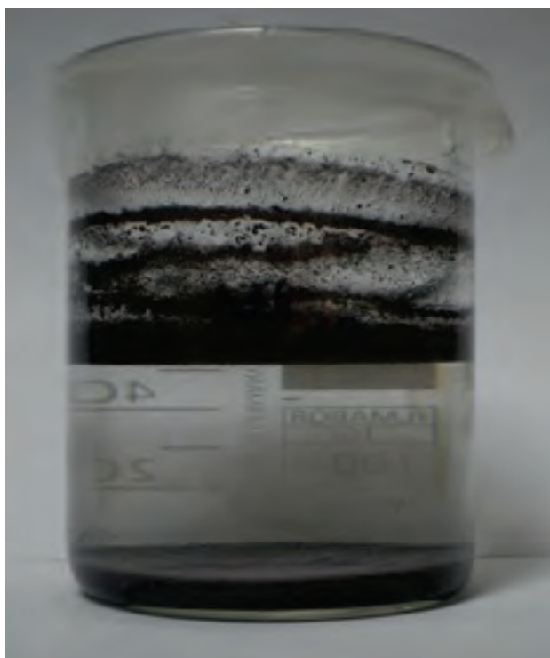
Slika 1. Uzorak obraden aluminijevim(III) sulfatom koncentracije 0,011 mol/L pri pH=4,5

Nakon što su uzorci odstajali do idućeg radnog dana, kod nekih je došlo do jasnog odjeljivanja faza kao npr. u eksperimentu koji je proveden uz koncentraciju aluminijevog(III) sulfata od 0,011 mol/L i pH 4,5-vrijednosti 4,5. (Slika 1).