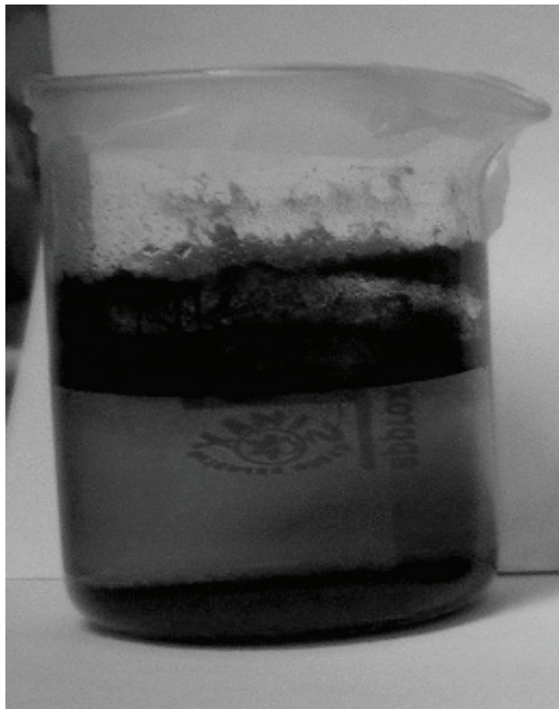
Slika 3. Uzorak obrađen željezovim(III) kloridom koncentracije 0,044 mol/L pri pH=2

Nakon što su uzorci odstajali do idućeg radnog dana, kod nekih je došlo do jasnog odjeljivanja faza kao npr. u eksperimentu koji je proveden uz koncentraciju željezovog(III) klorida od 0,044 mol/L i pH=2 (Slika 3).